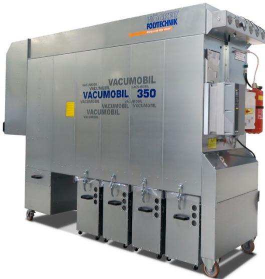
Vacumobil JT 350 mit Jetabreinigung und Staubsammeltonnen