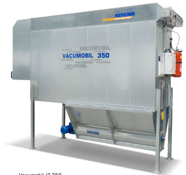
Vacumobil JZ 350 mit Jetabreinigung und Zellenradschleuse

(1) zugelassen für organische Stäube der Staubexplosionsklasse St1 mit einer Mindestzündenergie >10 mJ und einer unteren Explosionsgrenze von mindestens 30 g/m 3