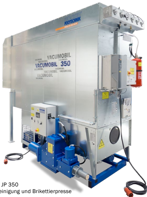
Vacumobil JP 350 mit Jetabreinigung und Brikettierpresse